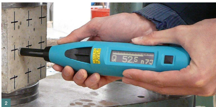
1 Základní typy odrazových tvrdoměrů – shora Schmidt M, Schmidt NR a N, Schmidt L, dole Schmidt P a PT 2 SilverSchmidt N ■ 1 Basic types of rebound hammers – top to bottom Schmidt M, Schmidt NR and N, Schmidt L, Schmidt P and PT 2 SilverSchmidt N

Jelikož technologie výroby betonu pokročila a vztah mezi pevností a tvrdostí může být pro různé betony rozdílný, vý-