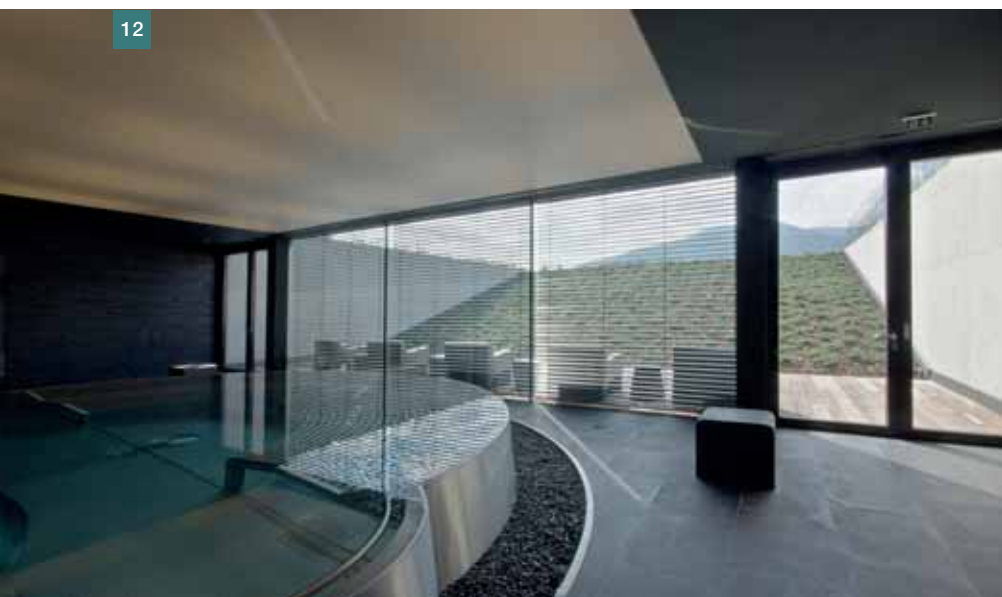
Obr. 12 Bazén vířivky ve spa ■ Fig. 12 Whirlpool in the spa