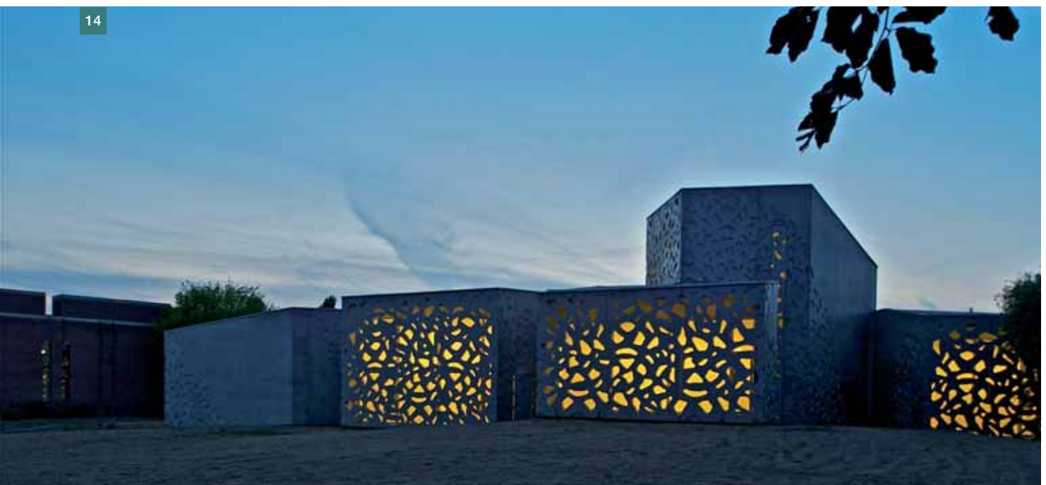
Obr. 14 Dokončená dostavba muzea ■ Fig. 14 Night view of the completed extension of the museum