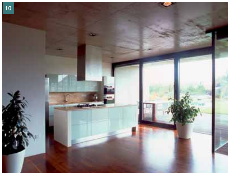
Obr. 10 Kuchyně ■ Fig. 10 Kitchen