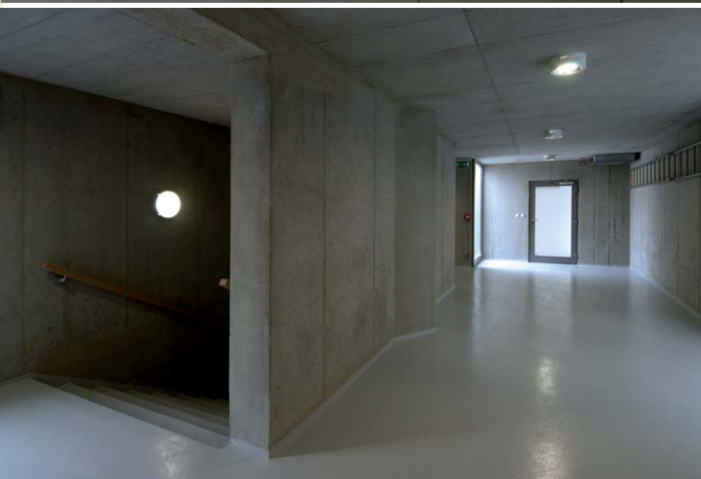
4 Rodinný dům v Praze a obytný prostor rozdělený betonovou příčkou, b boční stěna, c fasáda otevřená do zahrady 5 Polyfunkční dům Eucon v Praze na Žižkově, a vstupní hala, b vnitřní dvůr s obytnou zahradou a širokými pavlačemi, c vnitřní chodba