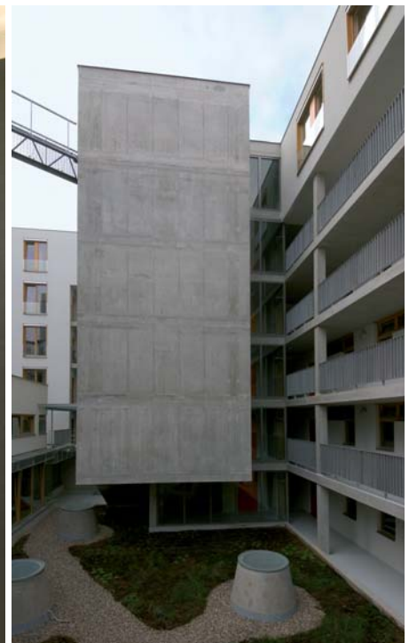
| 5a | | 5b | | 5c |