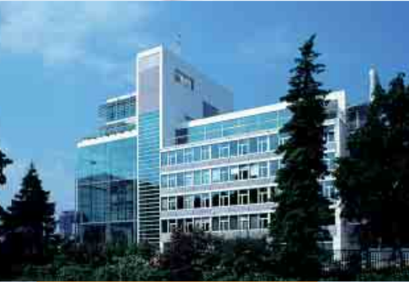
Praha, Administrativní budova Hlavní správy ČEZ, a. s. Prague, Office building ČEZ