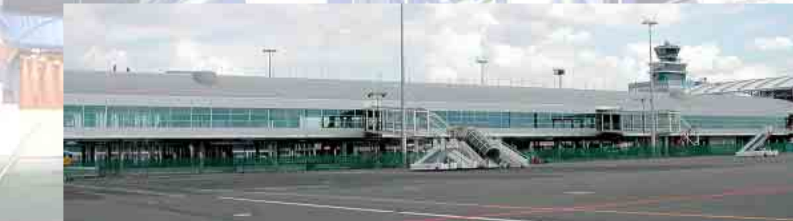
Praha, Terminál Sever 2 – Prst „C“ Prague, Finger C Terminal 2 North