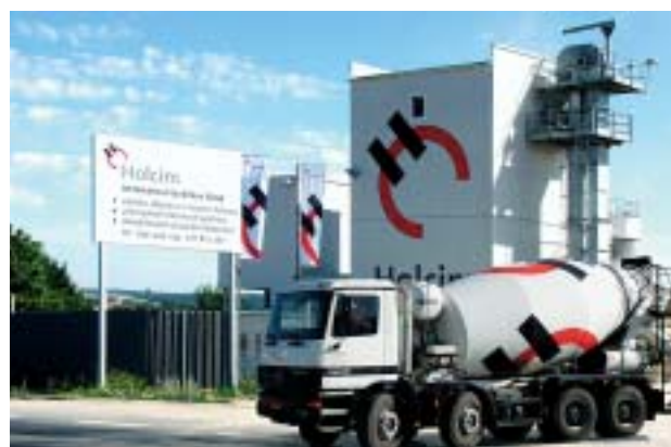
Obr. 2 Betonárna Havlíčkův Brod Fig. 2 The mixing plant Havlíčkův Brod