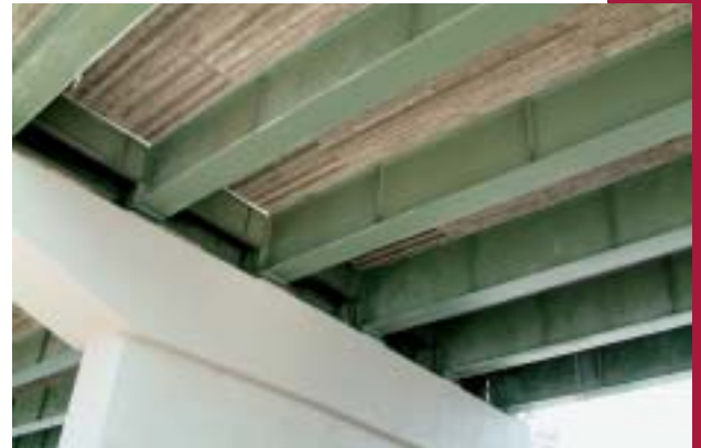
Obr. 4 Silniční obchvat Čáslav Fig. 4 The by-pass Čáslav