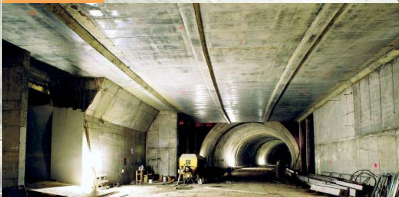
Záliv ZTT s napojením podzemní trafostanice West Tunnel Bay with Connection of Underground Transformer Station