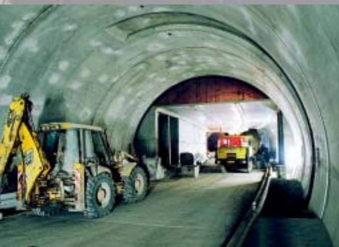
Zavěšený mezistrop v zálivu ZTT Intermediate Ceiling in the West Tunnel Bay