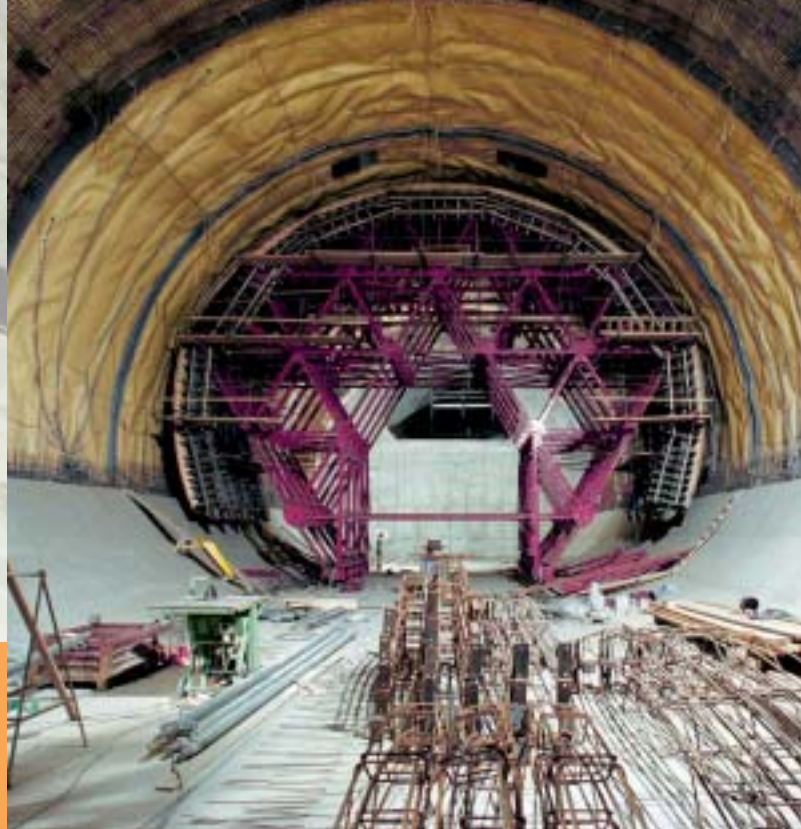
Bednění klenby podzemní strojovny vzduchotechniky Casing of the Vault of the Underground Airing Technique Machinery Room