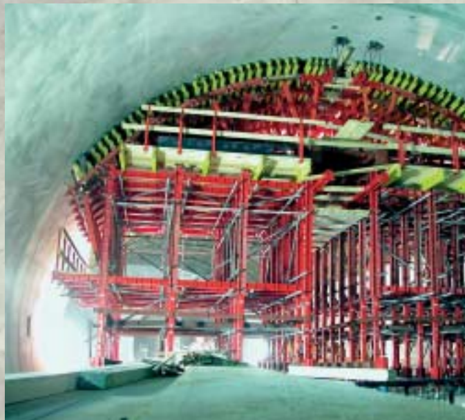
Bednění vrcholu klenby rozpletu ZTT Casing of the Vault Top of the West Tunnel Fork