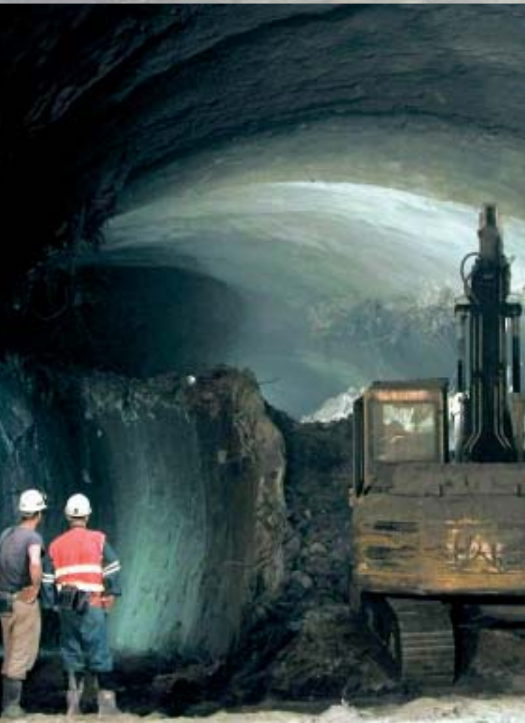
Ražby rozpletu ZTT Driving of the West Tunnel Fork