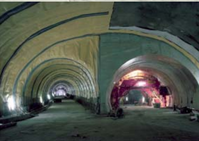
Čelo rozpletu VTT Forehead of the East Tunnel Fork