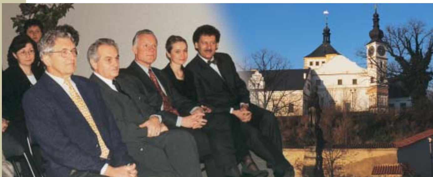
Fig. 2 Welcome Reception at Czech Concrete Days 2001