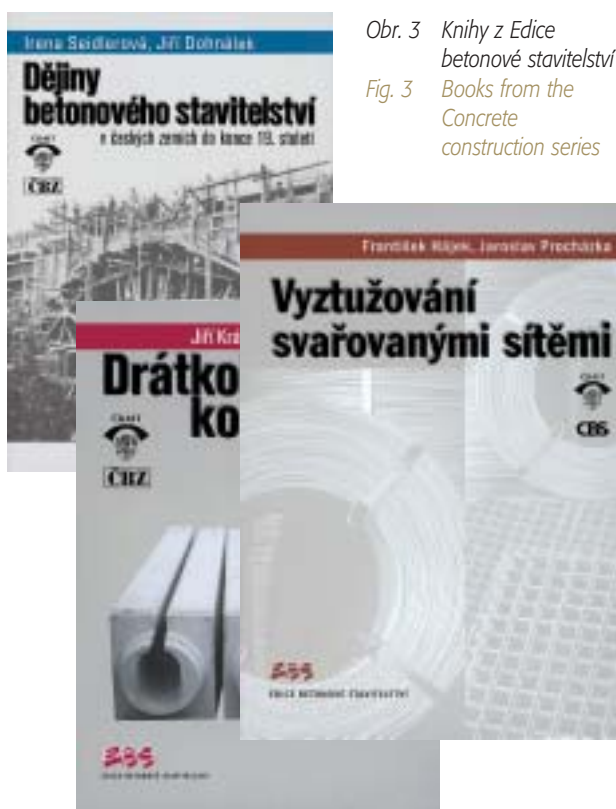
Obr. 3 Knihy z Edice betonové stavitelství