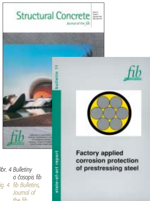
Obr. 4 Bulletiny a časopis fib

ČBS byla jedním z iniciátorů založení nového betonářského časopisu BETON – TECHNOLOGIE, KONSTRUKCE, SANACE. Nový časopis roku 2001 nahradil předchozí časopisy Beton