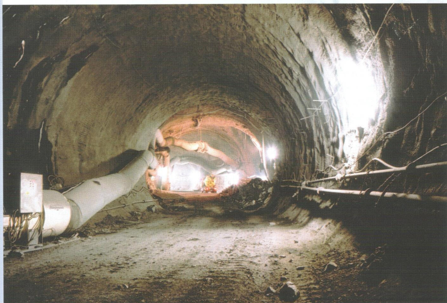
Silniční tunel Mrázovka – ražba z jihu

Tunnel driving within the Troja-Kobyličky line section, construction of underground line IV.C1