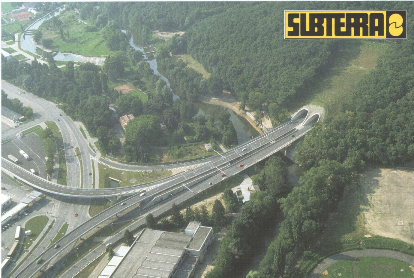
Silniční tunely na Pražské radiále v Brně

Road tunnels within the Prague radial road, Brno