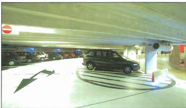
Obr. 5 – Patrové garáže (Dobytčí trh) v Groningenu nominované k udělení ceny / Parking building (Cattle Market) in Groningen nominated for Concrete Prize