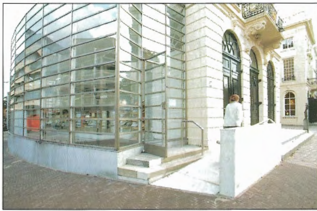
Obr. 4 – Betonářská cena v kategorii občanské stavby, přestavba a dostavba Královského divadla v Haagu / Concrete Prize in Public Structures category, reconstruction of The Royal Theatre in the Hague