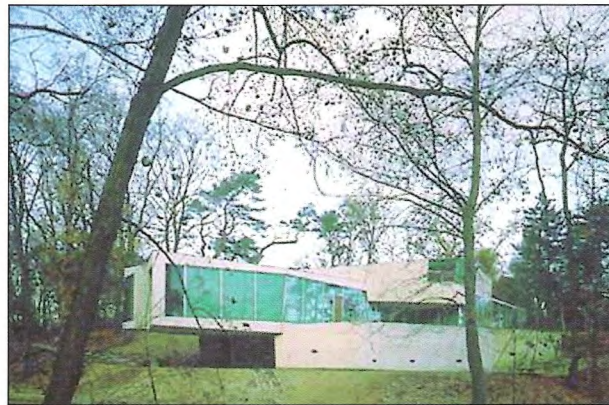
Obr. 1 – Betonářská cena v kategorii obytné stavby / Concrete Prize in Dwelling Houses category

Naši partneři k nám projevují nevšední vstřícnost. To se projevilo i při setkání výboru obou společností během sympozia fib v říjnu v Praze.