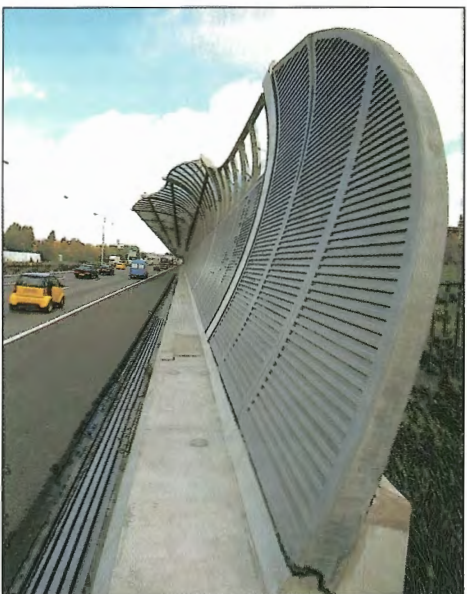
Obr. 8 – Protihluková stěna na státní silnici 16 v Doordrechtu nominovaná k udělení ceny / Acoustic wall on state road 16 in Doordrecht nominated for Concrete Prize