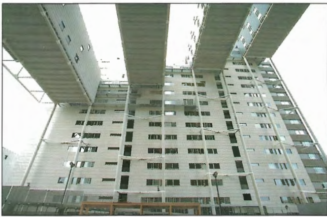
Obr. 3 – Studentské koleje v Utrechtu nominované k udělení ceny / Student residences in Utrecht nominated for Concrete Prize