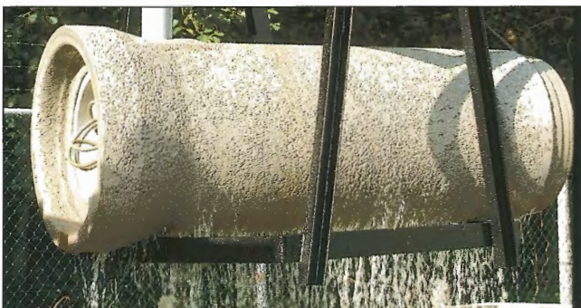
Obr. 9 – Propustné potrubí Permeo – buizen v Duivenu nominované k udělení ceny / Permeable pipe Permeo – buizen in Duiven nominated for Concrete Prize