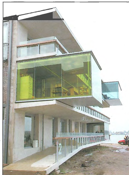
Obr. 2 – Krajní sekce bytového domu v Amsterdamu nominovaná k udělení ceny / Side section of the dwelling house in Amsterdam nominated for Concrete Prize