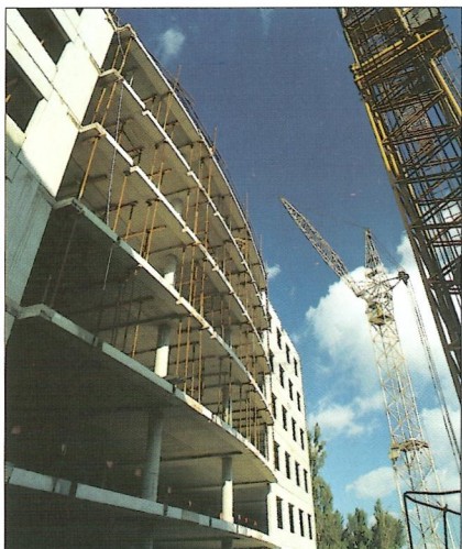
Plynárenské centrum Bratislava