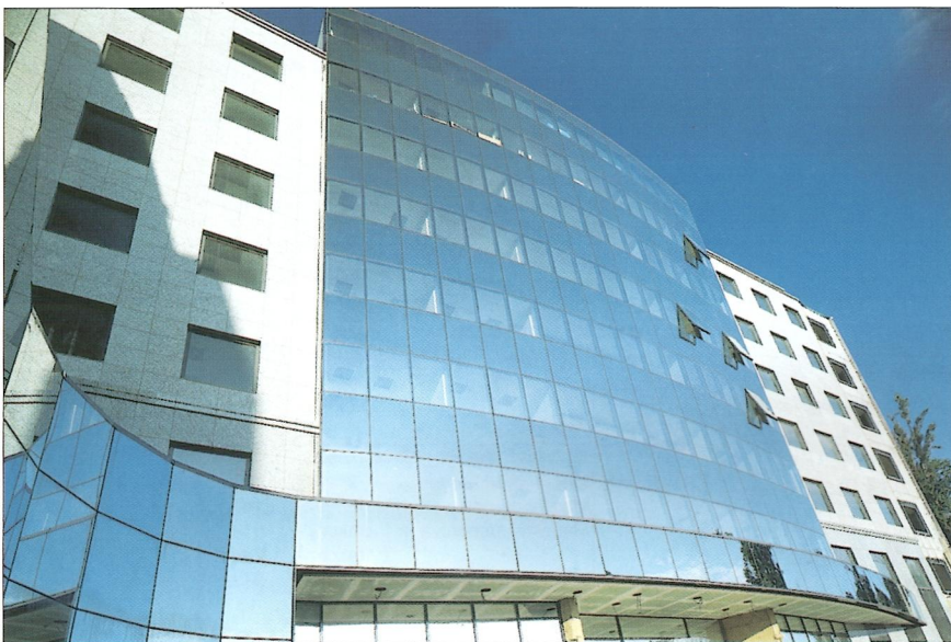
Obr. 1 – 5 – Plynárenské centrum Bratislava-Mlynské Nivy / The Gascenter Bratislava-Mlynské Nivy