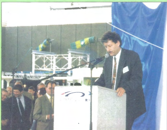
Pozvání ČBZ na pražské fib sympozium