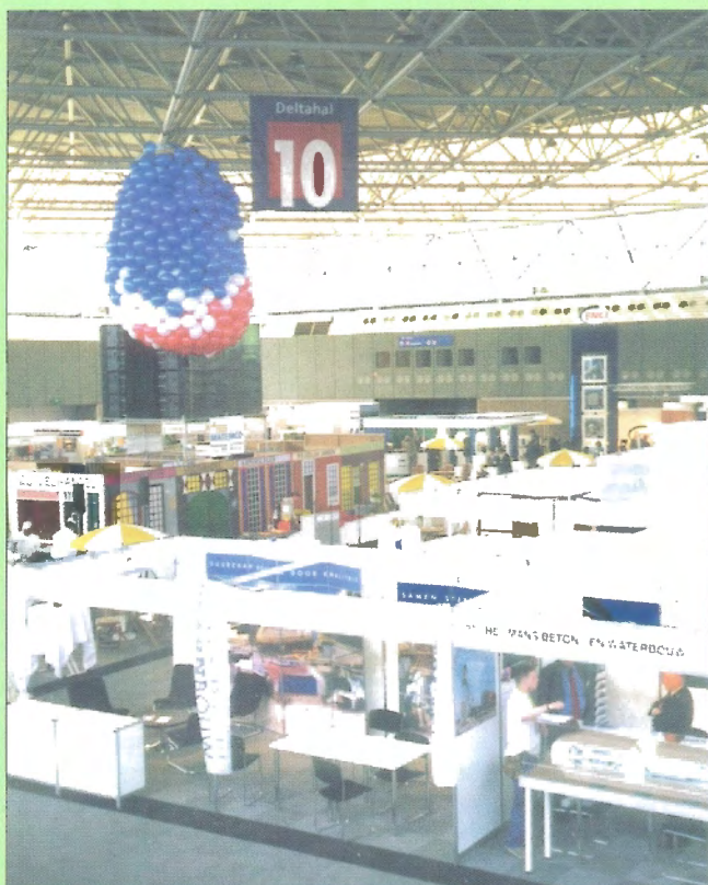
Výstava v Delta hale RAI centra