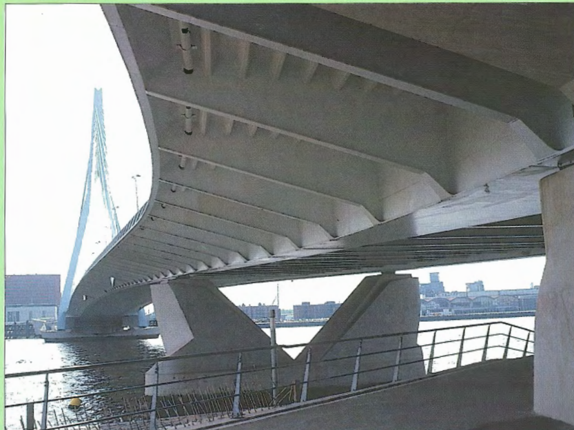
Most Erasma Rotterdamského