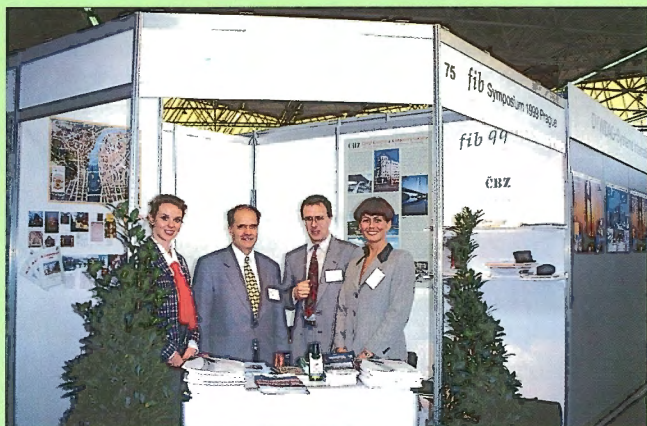
Stánek ČBZ na výstavě v rámci kongresu