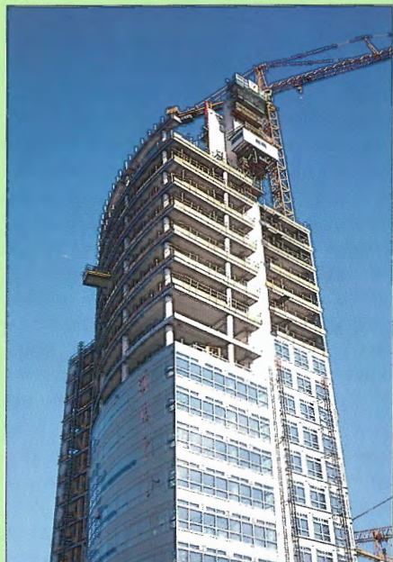
Z nové výstavby