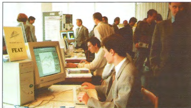
O odborné přednášky i o doprovodnou výstavu byl veliký zájem