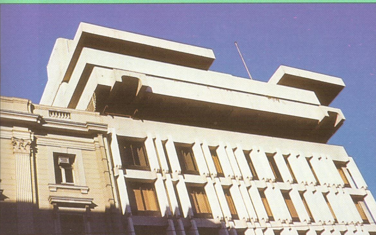
Athény (Athens) – Balkony nadstandardních bytů v horních podlažích budovy v centru města, tvořící zároveň zvukovou bariéru před hlukem z ulice / Balconies of de-luxe flats on upper floor of a building in the City of Athens, providing sound protection