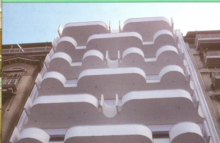
Soluň (Thessaloniki) – Nábřežní výstavba s plasticky tvarovanými balkony / A seaside development with plastic shaped balconies