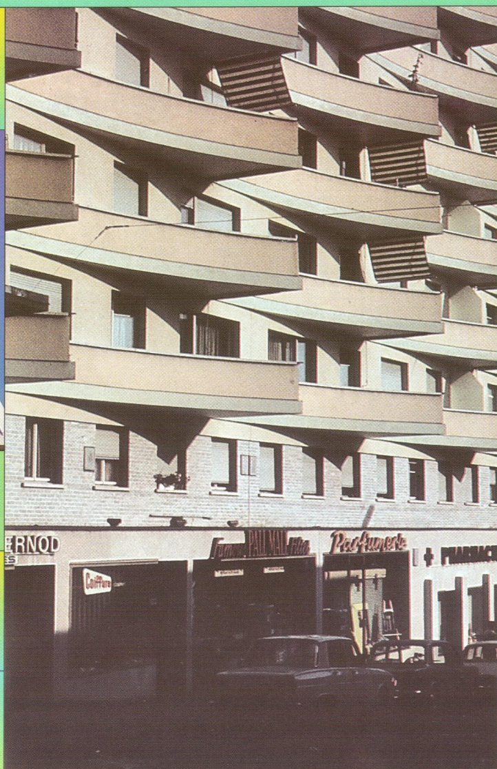
Montreux – Výstavba s balkony orientovanými k Ženevskému jezeru / Balconies oriented towards the Geneva lake

Několik ukázek budov s balkony z různých částí světa, buď též inspirací pro tvorbu našich architektů a inženýrů. Pavel Čížek