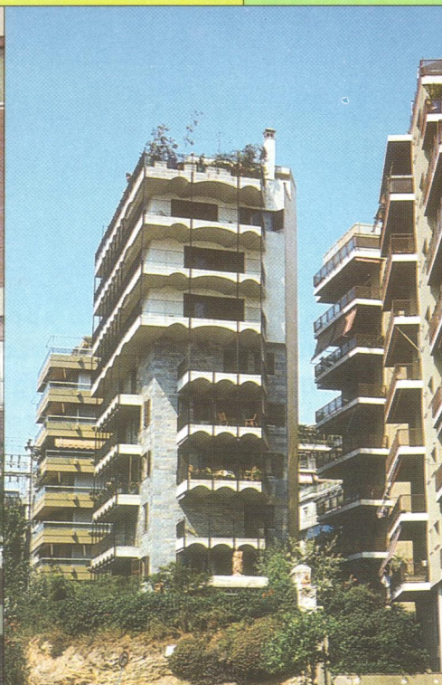
Athény (Athens) – Bytovky při pobřeží s balkony, které tvoří současně slunolamy / Seaside residential buildings providing sun protection