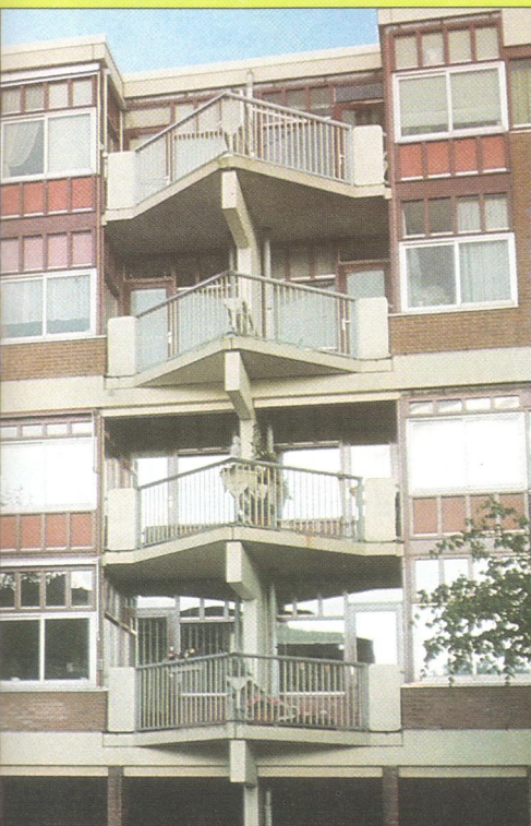
Amsterdam – Obytné balkony na sídlišti / Habitable balconies in a housing estate