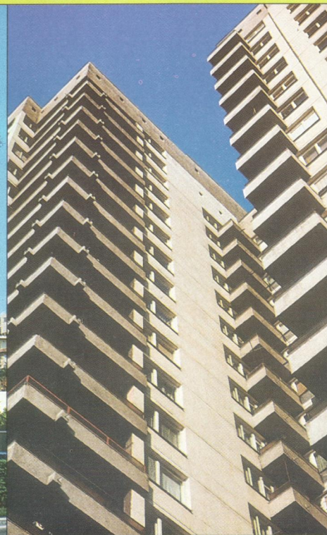
Sofie (Sofia) – Velkoryse koncipované balkony vysoké bytovky / Generously solved balconies of a residential tall building