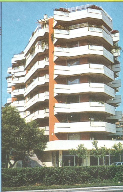
Athény (Athens) – Bytovky při pobřeží s průběžnými balkony a dělicími příčkami mezi byty / Seaside residential building with continuous balconies separated by external partition walls