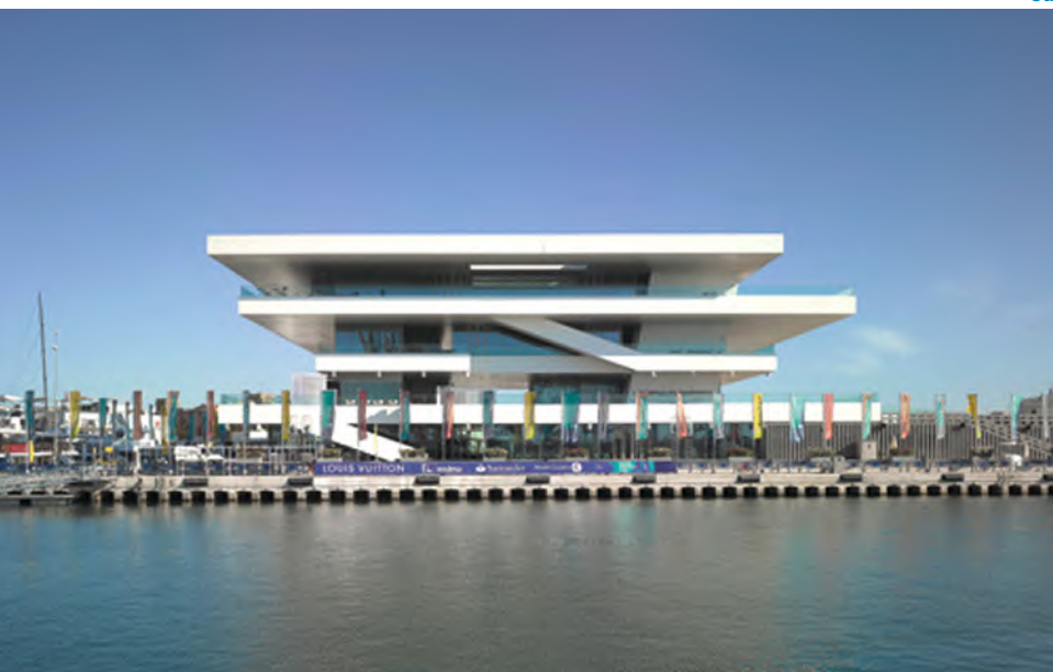
5 Budova Poháru Ameriky „Veles e Vents“ (Valencie, Španělsko, 2006) 5 America's Cup Building “Veles e Vents” (Valencia, Spain, 2006)

Revitalizace a dostavba polyfunkčního domu Morland Mixité Capitale (Paříž, Francie, 2022) zase oživila čtvrť pomocí cenově dostupného a zároveň luxusního bydlení, maloobchodních a restauračních prostor, hotelu a mládežnické ubytovny, prostoru pro umělecké instalace a městské střešní zahrady (obr. 4). Vyzdvižením nových objemů na klenutých nosných arkádách, které lemují parter původní budovy, vytváří architekt prostor pro setkávání a těm, kteří tudy procházejí k řece Seině